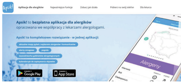
Rycina 2. Strona internetowa z opisem i linkami do pobrania aplikacji Apsik! ( www.apsik.eu , sponsor serwisu firma Mylan).

Aplikacja Apsik! jest przeznaczona dla lekarzy alergologów i ich pacjentów. Stanowi pomoc w diagnostyce i monitorowaniu objawów ANN (możliwość połączenia wykresu objawów z wykresem stężenia pyłku). Łączy serwis z informacjami na temat pylenia roślin (prognozy dla 9 regionów) z serwisem pogody i aktualnymi komunikatami o zanieczyszczeniu powietrza. Dodatkowo zawiera kalendarz pylenia roślin dla 4 regionów Polski. Aplikacja posiada najbardziej rozbudowany kwestionariusz objawów ANN, obejmujący wszystkie kluczowe objawy choroby, zgodny z zaleceniami MACVIA-ARIA.