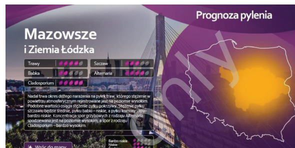
Rycina 4. Aplikacja Prognoza pylenia ( www.prognozapylenia.pl , sponsor serwisu i aplikacji firma Sanofi-Aventis).

Prognoza pylenia to aplikacja z komunikatami o pyleniu roślin w 9 regionach Polski. Dostępne są w niej komunikaty na temat stężenia pyłków w formie graficznej i tekstowej. Równoległe komunikaty prezentowane w atrakcyjnej graficznie animacji (oraz komunikat tekstowy) dostępne są na stronie w serwisie społecznościowym Facebook.