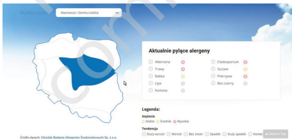
Rycina 3. Strona Mam alergię z informacjami oraz linkiem do pobrania aplikacji ( www.mamalergie.pl , sponsor serwisu i aplikacji firma Bayer).

Mam alergię to rozbudowany serwis informacyjny dla alergików obejmujący komunikaty o pyleniu roślin w 9 regionach kraju, prognozę pogody, a także bazę wiedzy o alergenach i alergii krzyżowej. Komunikaty dostępne są również w aplikacji na urządzenia mobilne. W serwisie dostępny jest też kalendarz pylenia roślin dla 4 regionów Polski. Aplikacja zawiera kwestionariusz codziennej rejestracji nasilenia objawów chorobowych w wizualnej skali analogowej (VAS, visual analogue scale ).