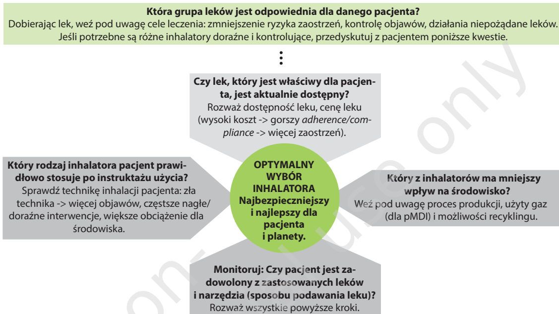
Rycina 3. Wspólne podejmowanie decyzji przy doborze inhalatora przez lekarza i pacjenta.

wo-naczyniowego i poprawę jakości życia [8]. U nieaktywnych fizycznie osób dorosłych z umiarkowaną/ciężką astmą interwencje związane ze zwiększeniem aktywności fizycznej wiązały się ze zmniejszeniem objawów choroby i z poprawą jakości życia [9].