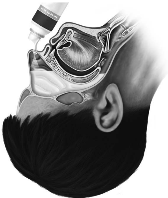
Rycina 3. Zastosowanie roztworu wody morskiej i soli fizjologicznej w kroplach w leczeniu zapalenia zatok przynosowych.